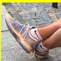
Nach siegreichem Spiel

Die Tennisplätze müssen auch verstärkt gewässert werden, am besten auch während der Spielstunde mal kurz. Unsere Plätze sind so konzipiert, dass sie das Wasser unter dem Platz speichern und langsam nach oben abgeben. Das können sie natürlich nur, wenn dort auch mal genug Wasser angekommen ist. Idealerweise sollten die letzten Spieler des Tages den Beregner nochmal richtig laufen lassen bevor man geht.